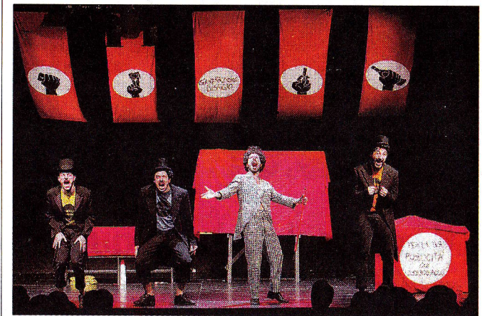
Il Teatro della Tosse il 1° ottobre celebra i suoi primi 40 anni