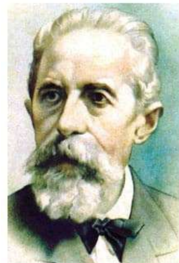
Fondazione Nazionale di Studi Tonioliani - Campania